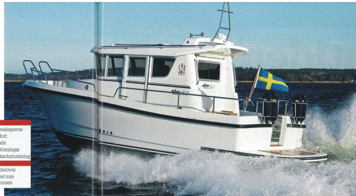
Båten lägger sig själv i närmsom åker i "baksätet". Den främre passagerarstolen är smurrbar och man kan på det viset sitta fyra vid bordet. Takiuckan är jättestor, med öppna dörrar och öppen taklucka är det lite som att åka "nercabba".

Aktersoffan ser större ut än vad den är, fler än tre vuxna kan inte sitta här, då får inte benen plats, men de tre sitter bra. Tack vare att akterpassagerarna sitter lite högre än föraren har även de utmärkt utsikt åt alla håll, inte minst framåt och det gör storkok till en upplevelse för dem