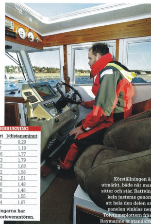
Körställningen är utmärkt, både när man sitter och står. Rattvinkeln justeras genom att höla den delen av panelen vinklas ner. Två värmestruntningar från Raymarine är standard.

Styrhytten upplevs som stor och ljus, vilket inte är så konstigt efter-