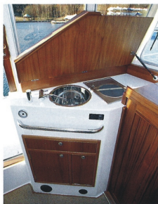
Pentryt fungerar fint, men några storkok blir det nog inte, och var gör man av kastrullerna?

Föraren har utmärkt sikt åt alla håll – utom akteröver. Att lägga till med babordsidan i trångt läge är bokigt när man inte ser var båten slutar, ett problem som delas med de flesta större hyttbåtar. En större ruta akteröver hade löst problemet. Förutom det är det här en båt som går bra att hantera ensam, båten lyder fint vid läg-