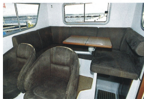
Benutrymmet begränsar antalet personer i soffan till tre. Till höger syns nedgången till akterkabinen.

» som den mest består av fönster. Förarplatsen är utmärkt, stolen är justerbar i längsled och det finns fotstöd om du sitter och kör, med uppfällid sittdyna står du bra om du är kortare än 195 centimeter. Rattvinkeln justeras enkelt genom att hela rattkonsolen vinklas och spakar och reglage sitter där de ska, med undantag för startnyckeln. Det finns egentligen ingen anledning till att den ska sitta precis där man tränger sig mellan sätet och ratten när man ska genom styrbordsdörren.