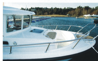
Fördäcket är litet eftersom förpiken tar plats. Ordentliga grabbräcken och stävstege gör det enkelt att gå i land.

Minor Offshore 28 är ingen billig båt, men man får vad man betalar för. ■