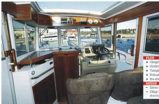
Ljust och med god sikt runt om, även för dem som sitter bak. Takiuckan är rejält stor.