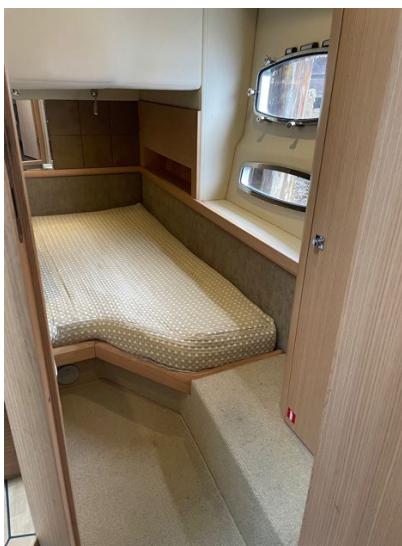
Toa akte ruff (sb-sida), pentry (bb-sida)